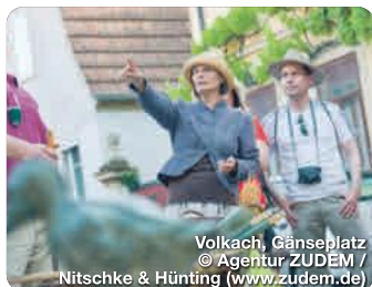
Volkach, Gänseplatz