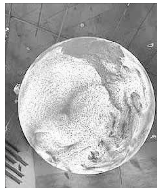
Ralf Kaiser Text und Bilder/Schule

Dinge auszuprobieren und somit aktiv in die Materie einzusteigen war für die Schüler und die Lehrer sehr reizvoll. Die Auszeichnung, Profilschule für Informatik und Zukunft, PIZ, der Mittelschule Frensdorf, war natürlich ein weiterer Grund dieses Museum zu besuchen. Im Anschluss konnten sich dann alle auf dem berühmten Christkindlesmarkt stärken und sich in weihnachtliche Stimmung versetzen lassen.