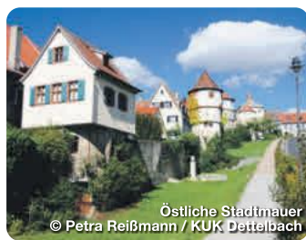
Östliche Stadtmauer