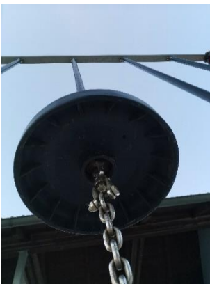
Wo ist dieses Spielgerät zu finden?