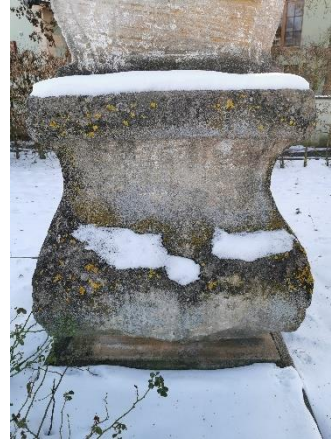
An welcher Kreuzung steht dieser Bildstock?