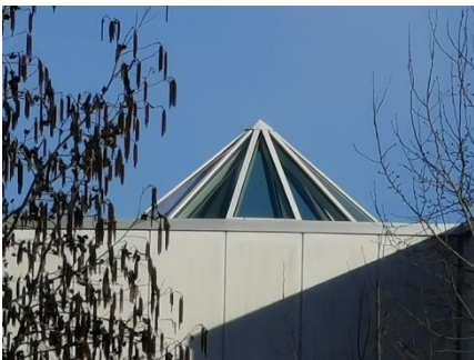
Hausnummer dieses Gebäudes?