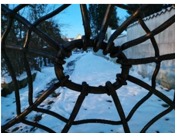
Wo findet Ihr dieses kunstvolle Tor?