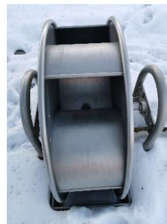
Wo findet ihr dies?