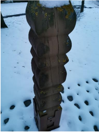
Wo ist dieser Bildausschnitt zu finden?