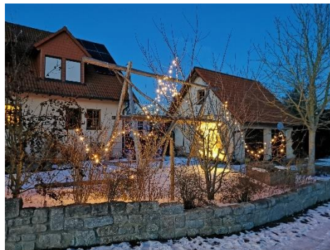
Welche Adresse hat das Haus unseres Fotografen?